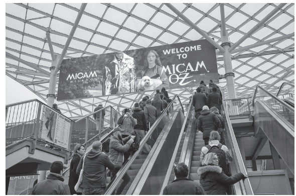
ミカム会場エントランス付近

2023年秋冬に向けたミカムは、2月19～22日の4日間行われた。終了翌日にリリー