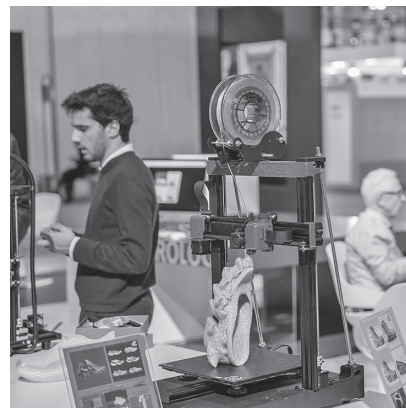
新テクノロジーに関する展示