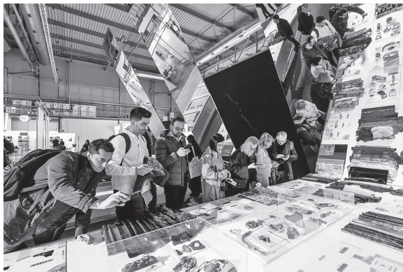
リネアペレと連携した2023年秋冬注目素材展示

また“MICAM X”では、皮革製品素材の展示会リネアペレと連携し、2023年秋冬注目素材の展示も行われた。