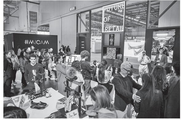
“MICAM X”内の未来の小売店に関する展示