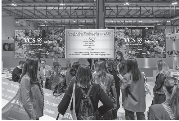
サステナビリティ認証「VCS」の展示