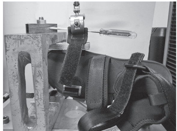
図2 バンドの取付強さ試験 (スポーツサンダル)