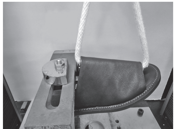
図1 バンドの取付強さ試験 (1枚甲バンドのサンダル)