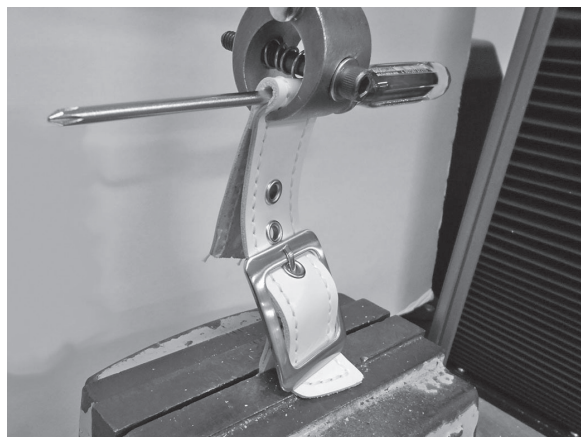
図4 引張強さ試験 (バックルをベルトに付けた状態で試験した例)