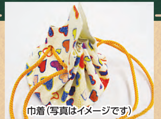
巾着(写真はイメージです)